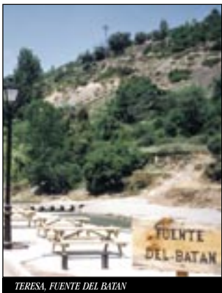
TERESA. FUENTE DEL BATAN