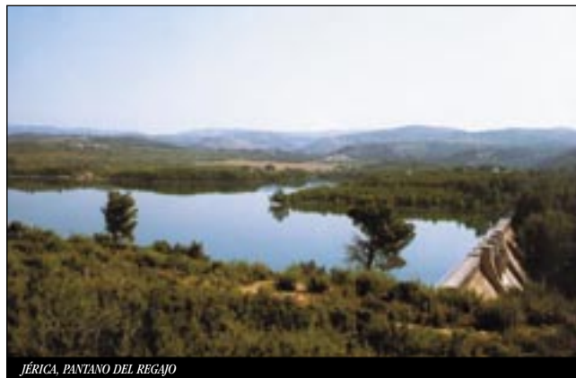
JÉRICA. PANTANO DEL REGAJO