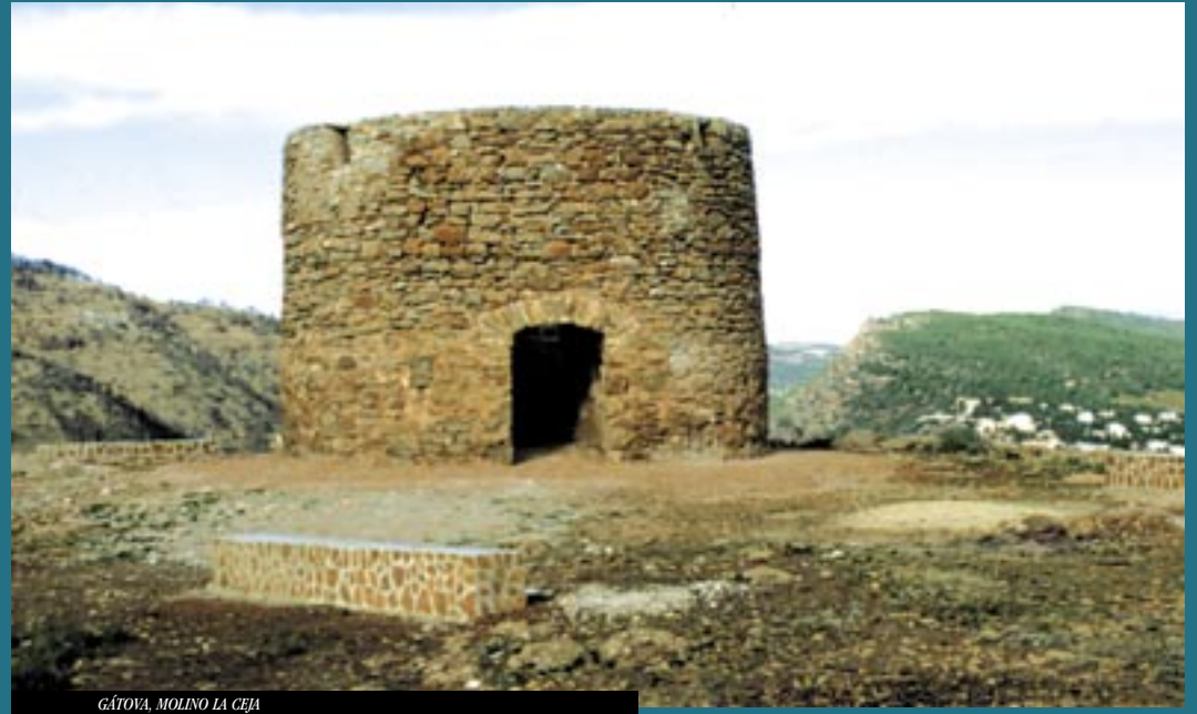
GÁTOVA, MOLINO LA CEJA