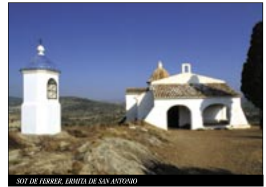
SOT DE FERRER. ERMITA DE SAN ANTONIO

Águeda (5 de febrero), Semana Santa (abril), San Roque (16 de agosto), Divina Pastora (septiembre).