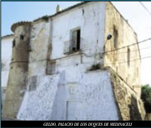
GELDO, PALACIO DE LOS DUQUES DE MEDINACELI