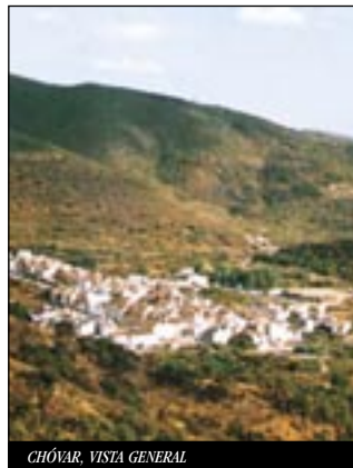
CHÓVAR. VISTA GENERAL