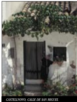
CASTELLNOVO. CALLE DE SAN MIGUEL