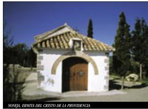
SONEJA. ERMITA DEL CRISTO DE LA PROVIDENCIA